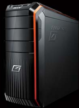
ブラック基調の存在感のあるボディにオレンジのラインアートをプラス。

ツールレスで保存容量をアップできるEasySwap対応のHDドライブベイを装備。増設はもちろん、大容量データの移動にも便利です。 *HDDの増設等を行う際は必ず本体の電源をお切りください。