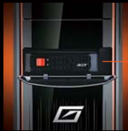
EasySwap対応HDドライブベイ