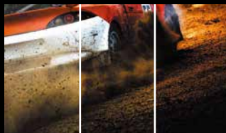
ブラック・ブースト

ジャンルに応じて最適な映像モードを8種類から選べる「GameView」機能や、黒の強弱を11段階に調節して暗がりでの視認性を高める「ブラック・ブースト」機能などゲームに合わせた最適な環境で楽しめます。