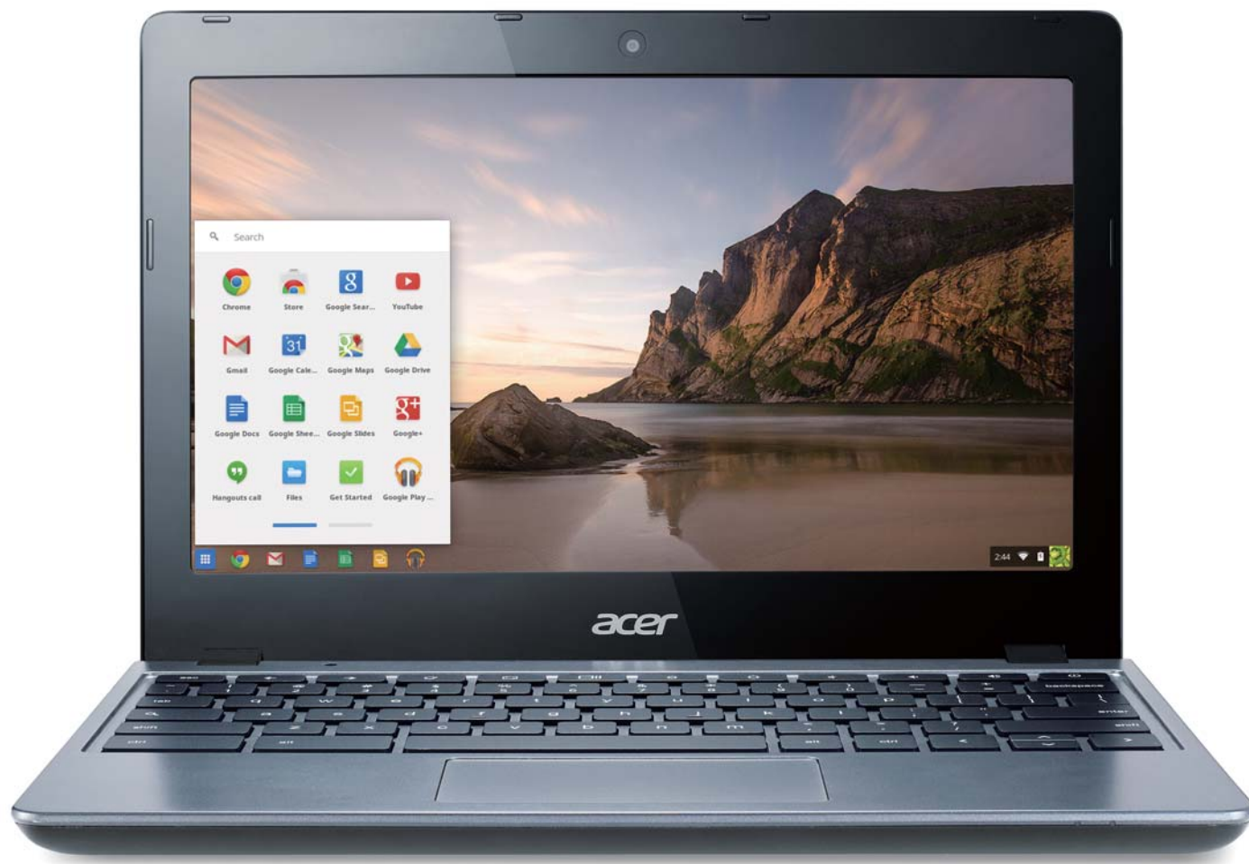
*販売モデルのキーボードは日本語仕様です。