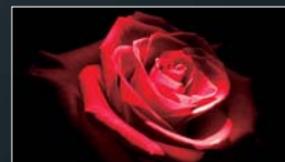
高コントラスト比

独自のACMテクノロジーにより、1億:1の超ハイコントラスト比を実現。映像も写真も文字も、すべてメリハリのあるくっきりとした表現クオリティによる見やすさです。