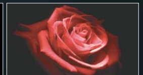
低コントラスト比