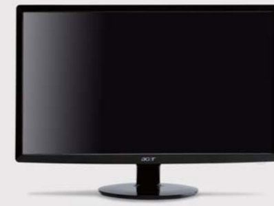
21.5 inch ワイド液晶 S221HQLbid