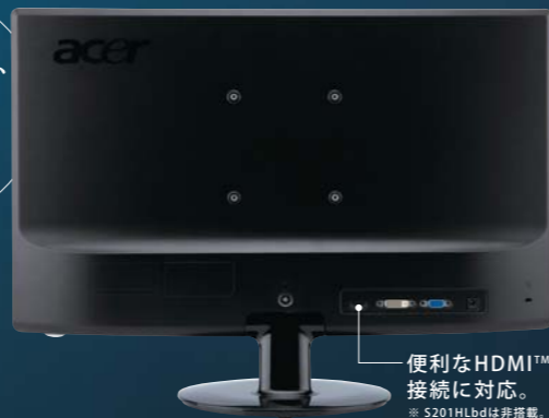
便利なHDMI™ 接続に対応。 ※ S201HLbdは非搭載。