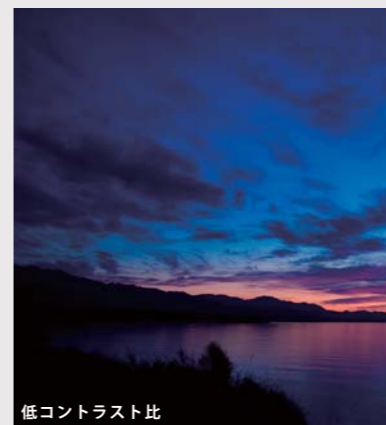
低コントラスト比