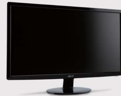
23 inch ワイド液晶 S231HLbid