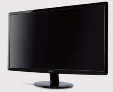
20 inch ワイド液晶 S201HLbd