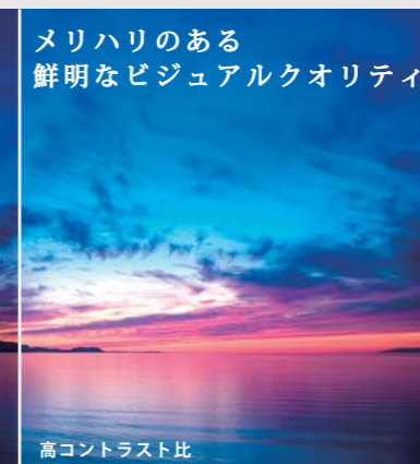
高コントラスト比