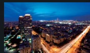
ATI Radeon™ HD 5450