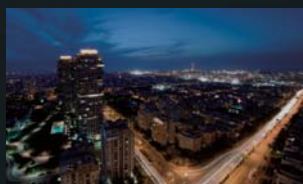
グラフィック性能が低い場合

処理を高速化するATI Stream テクノロジーを備えたATI Radeon™ HD 5450があれば、高度な描画性能を要求するDirectX®対応の3D ゲームも過酷なエンコーディングも快適に実行できます。HD動画などの視聴も、驚くほどリアリティのあるビジュアルクオリティで楽しめます。