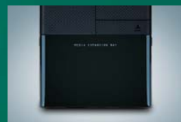
USBやカードリーダーを使用しない時は、 防塵カバーを開けてシンプルスタイルに。