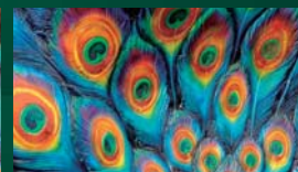
インテル® HD グラフィックス 2000