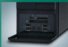
よく使うUSBポートとデータ移動に 便利なカードリーダーを装備。

シンプルさを個性にしたオールブラックのボディ。どんなお部屋にも映えるシックなスタイルながら、USBやカードリーダーを思いのままに使える、実用性も兼ね備えたルックスに仕上がっています。