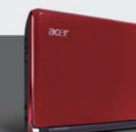
Ruby Red ルビーレッド