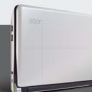
Seashell White シーシェルホワイト

パールのような優美なきらめきを放つ4つのカラーをラインナップ。全色、どこに置いても絵になるエレガントな美しさです。自分好みのカラーを選べば、きっとあなたらしいネットライフが楽しめることでしょう。