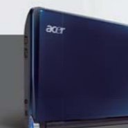
Sapphire Blue サファイアブルー