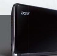
Diamond Black ダイヤモンドブラック

*掲載の製品写真は3Cellバッテリー(オプション)搭載時のもので、発売モデルの6Cellバッテリー仕様のものとは異なります。