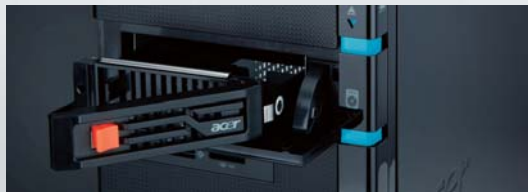
*HDDの増設等を行う際は必ず本体の電源をお切りください。

ツールレスで保存容量を増強できるEasySwap対応のHDDベイをフロントに装備。大容量データの移動などもIN・OUTのシンプルステップで行えます。